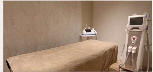
美容サロン 運営事業

美容機器を中心に、空調家電、化粧品、サプリメントなどのOEM、ODMを承っております。化粧品メーカー様、美容サロン様を中心に様々なクライアントからご依頼いただいております。