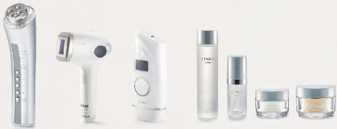
ホームユース美容健康商品 製造販売事業

海外からのトレンドを事前にリサーチし、美容機器、健康機器、化粧品、インナービューティーを中心にご家庭でより美容健康に役立つ商品を製造、販売しております。