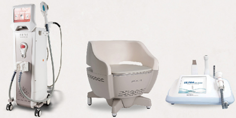
プロフェッショナル美容健康商品 製造販売事業

フェイシャル、痩身、脱毛に加え、フェムケアといった新規カテゴリーまで幅広く、美容健康に関連するプロフェッショナル機器や消耗品の製造、販売をしております。