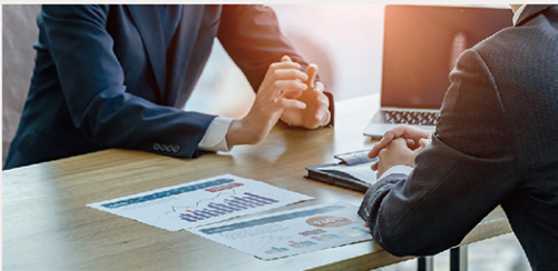
美容健康商品 OEM ODM 製造受託事業

美容機器を中心に、空調家電、化粧品、サプリメントなどのOEM、ODMを承っております。化粧品メーカー様、美容サロン様を中心に様々なクライアントからご依頼いただいております。