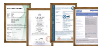
第三者機関認証の一部